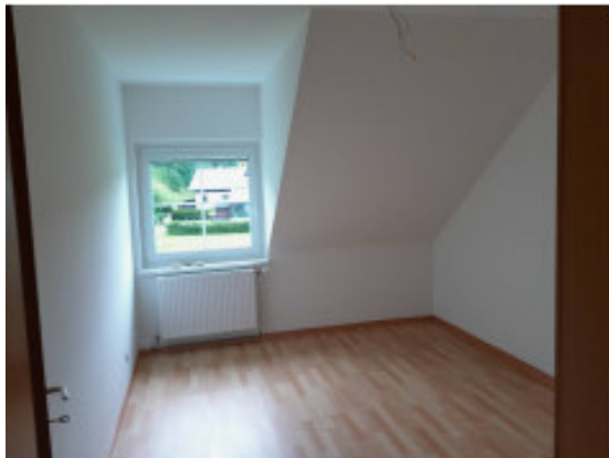
Kinderzimmer – ca. 10,15 m 2