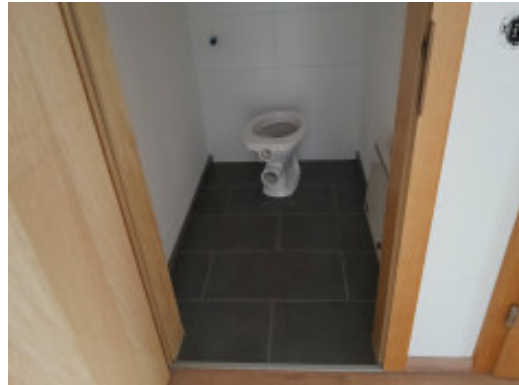
WC – ca. 1,64 m 2