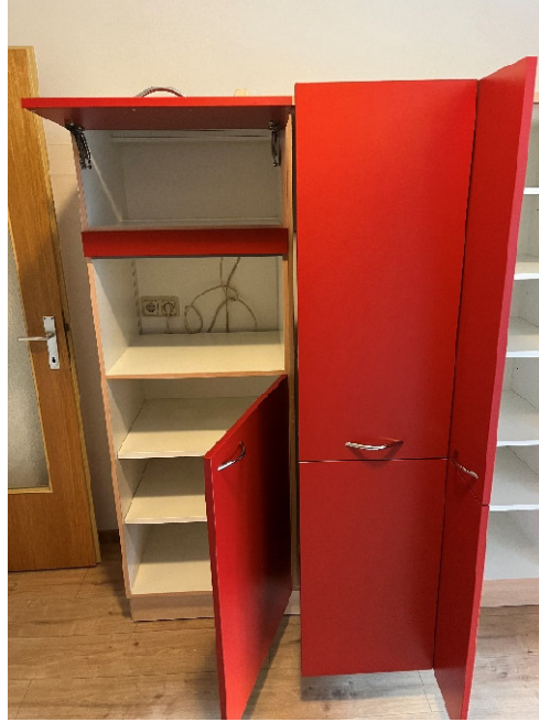
Wohnzimmer – ca. 22,32 m 2