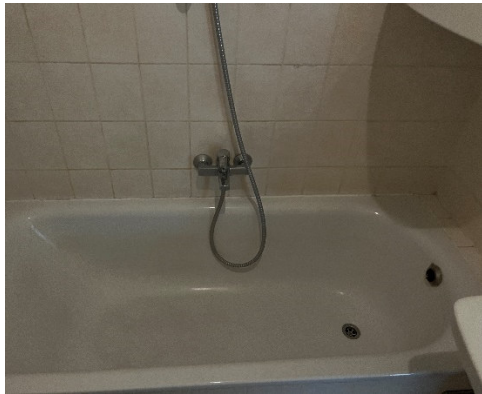
Badezimmer – ca. 4,32 m 2